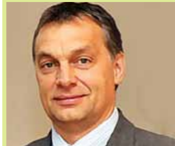
ORBÁN VIKTOR Magyarország miniszterelnöke A Puskás Ferenc Labdarúgó Akadémia alapítója Prime Minister of Hungary Founder of the Ferenc Puskás Football Academy

A magyar labdarúgás megújulásáról beszélni egy húsvéti torna kapcsán kézenfekvőnek tűnik. A sport valóban közösséget teremt, örök értékeket őriz és közvetít, a fiatalok nevelésében pedig manapság az egyik leghatásosabb, legnemesebb eszköz. Nagyszerű, hogy a Magyar Suzuki Zrt. és azok a tekintélyes támogatók, cég- és sportvezetők, egykori és jelenlegi játékosok, akik immár negyedszer tisztelik meg jelenlétükkel, kiállításukkal, segítségükkel a PUSKÁS-SUZUKI KUPA küzdelmeit, éppen egy utánpótlás-eseményre gyűlnek össze immár hagyományosan, hiszen ez megerősíti az üzenetet, amelyet a kormány is jól tud: csakis a gyerekek, az új nemzedék révén állítható talpra a magyar labdarúgás. Ezért kiemelt figyelmet fordítunk az utánpótlásprogramokra, hogy nemzeti örökségünk, Puskás Ferenc szeretett játéka, a hosszú-hosszú bőjt után feltámadjon.