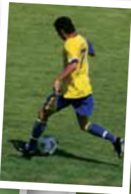
Álvaro MORATA (Real Madrid)

A 2009-es Puskás-Suzuki-kupán hat góllal gólkirály lett, jelenleg már a Real Madrid felnőtt csapatában játszik. Morata was the tournament's top goalscorer in 2009 with six goals and now plays in Real Madrid's first team.