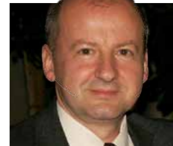
Dr. Simicskó István Emberi Erőforrások Minisztériuma, sportért és ifjúságért felelős államtitkár The Secretary of State for Sport, Ministry of Human Resources

Az elmúlt két esztendő során mintegy ötvenezerrel nőtt a futballozó fiatalok száma Magyarországon, s bízom benne, hogy a sikerhez a sportkormányzat is hozzájárult a társaságiadó-kezelési rendszer kialakításával, az akadémiai rendszer és az újraindított Bozsik-program kiemelt támogatásával. Megtiszteltetés számomra, hogy a 6. Puskás-Suzuki-kupa védnökeként lehetek jelen a rangos U17-es nemzetközi ifjúsági labdarúgótornán, és a helyszínen köszönhetem Önöket.