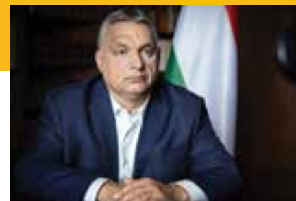
ORBÁN VIKTOR alapító, Puskás Akadémia Founder, Puskás Academy