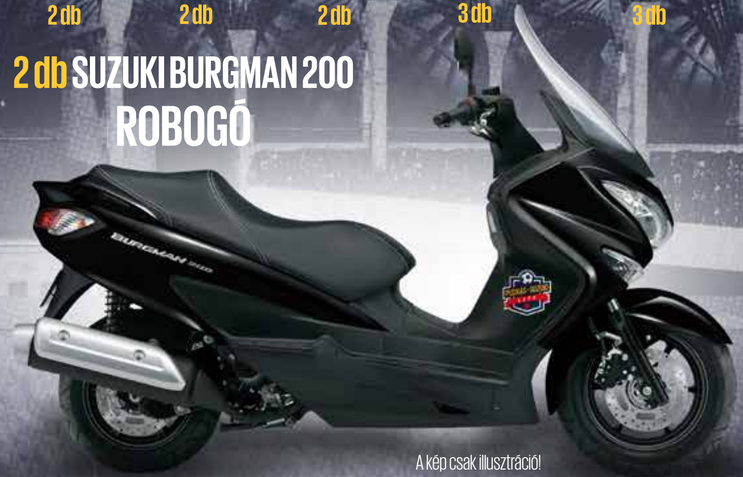
A kép csak illusztráció!

puskasakademia.hu PuskasAkademia puskasakademia marketing@pfla.hu